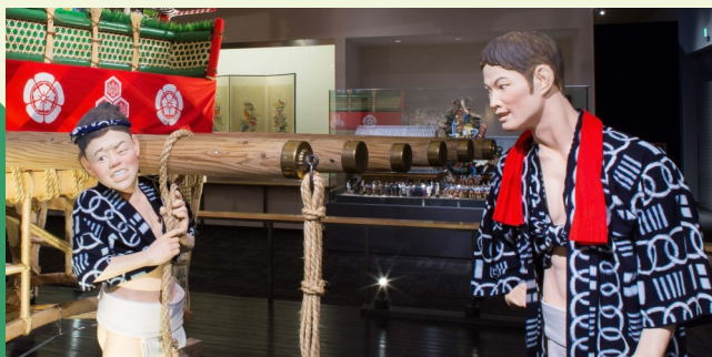
福岡市博物館の博多祇園山笠の展示

残念ながら今年は新型コロナウイルスの影響で実際の行事は見ることはできませんが、福岡市博物館の常設展示では博多祇園山笠の追い山が展示されています。山笠の息吹を感じて夏を乗り切りましょう。