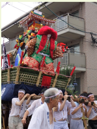
唐原の祇園山笠行事

毎年7月1～15日に博多で行われる国指定重要無形民俗文化財の博多祇園山笠行事の他にも、福岡市内では博多の影響を受けて始まったと見られる山笠行事がいくつかあります。その中で、 とうのはる おろのしま 唐原と小呂島の山笠は福岡市の指定文化財となっています。