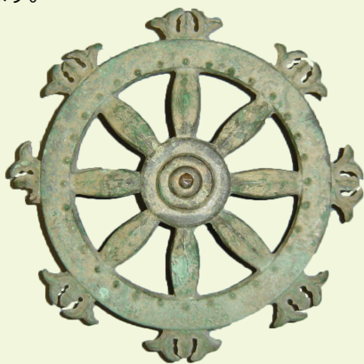
輪宝 青銅製 約19cm（福岡城跡出土） 福岡市指定有形文化財 福岡市博物館常設展示室で展示中

これらの遺物は、福岡城の築造にあたって地鎮祭 さいし のような祭祀を行った時に埋納されたものと考えられます。福岡城は1601（慶長6）年から7年の歳月をかけて築城されましたが、城の築造に携わった人々の願いや祈りを知ることができる貴重な資料です。