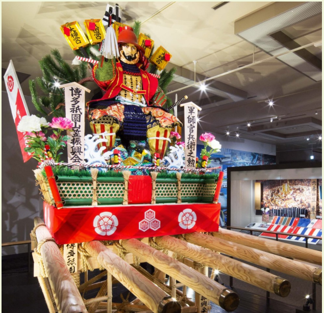
福岡市博物館の博多祇園山笠の展示