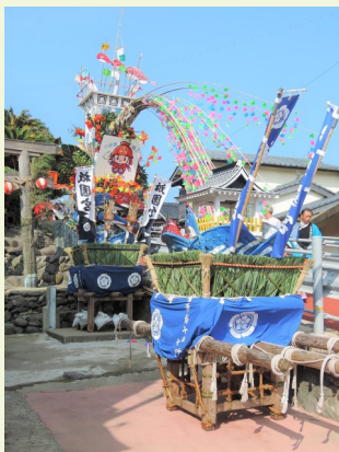
小呂島の祇園山笠行事

残念ながら今年は新型コロナウイルスの影響で実際の行事は見ることはできませんが、福岡市博物館の常設展示では博多祇園山笠の追い山が展示されています。山笠の息吹を感じて夏を乗り切りましょう。