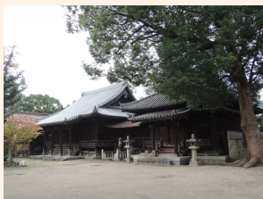
東光院境内(博多区吉塚) 見学時間：9時～17時 休館日：年末年始 (12/29～1/3)

この本尊のほか、明治維新の廃仏毀釈の際に住吉神社の神宮寺であった円福寺から移されてきた薬師如来坐像と十二神将立像は、美術史上貴重な資料として、国の重要文化財に指定されています。昭和56年に東光院は無住となりましたが、仏教美術品は福岡市美術館に所蔵され、寺跡は史跡として市が大切に管理しています。