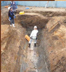
堀の発掘調査の様子 作業も一苦労です。

貿易都市・博多やその周辺は、戦国武将たちの争奪の対象として戦火にさらされることもありました。そのようななか、小田部城は地域の防衛拠点の一つであったと考えられ、その調査成果は戦乱の世の緊張感を今に伝えてくれます。