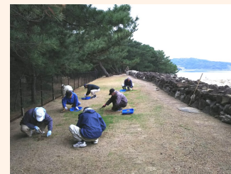
保存会による除草活動(生の松原)

西区生の松原では、地元の生の松原地区元寇防塁保存会が中心となって、毎月1回、除草活動が行われています。