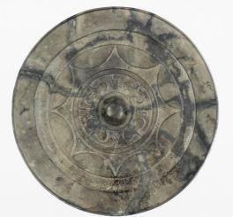
仲島遺跡の内行花文鏡

今回の目玉は、仲島遺跡5次調査(博多区井相田)で出土した弥生時代の内行花文鏡です。この時期の福岡平野では完形の中国鏡の出土は少なく、貴重な資料です。鏡の背面に施された文様や文字も鮮明に確認できます。ぜひご覧ください。