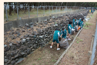
高校生によるボランティア清掃(今津)

同じく西区今津では、地元の今津元寇防塁松原愛護会とボランティアの人たちによって、清掃活動や松原の手入れが行われ、きれいな状態が保たれています。