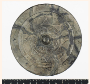
仲島遺跡の内行花文鏡

今回の目玉は、 なかしま 仲島遺跡5次調査（博多区井相田） いそうだ で出土した弥生時代の内行花文鏡 ないこう かもん です。この時期の福岡平野 きょう では完形の中国鏡の出土は少なく、貴重な資料です。鏡の背面 かんけい に施された文様や文字も鮮明 ほどこ に確認できます。ぜひご覧ください。