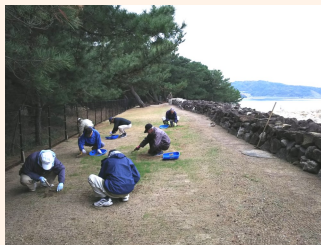
保存会による除草活動(生の松原)

いき まつばら 西区生の松原では、地元の生の松原地区元寇防塁保存会が中心となって、毎月1回、除草活動が行われています。