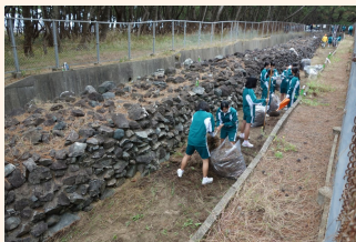
高校生によるボランティア清掃(今津)

いまづ 同じく西区今津では、地元の今津元寇防塁松原愛護会とボランティアの人たちによって、清掃活動や松原の手入れが行われ、きれいな状態が保たれています。