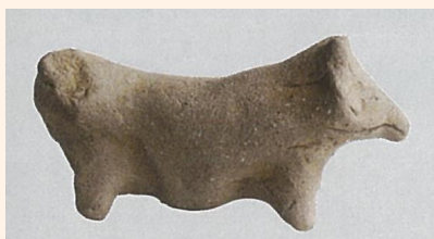
元岡・桑原遺跡群42次調査出土の「ブタ」 〔調査担当者はブタ形土製品と考えていますが、 モデルになった動物については諸説あります。〕

中国では、2000年前の漢の時代から、ブタは財産や子宝の象徴として縁起の良い動物と考えられてきました。元岡・桑原遺跡群は中国の銅銭が出土するなど中国文明との接点があった遺跡です。その影響を受けて、弥生人はブタの形の土製品を作り、豊作や子孫繁栄を願っていたのかもしれません。