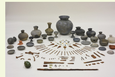
重要文化財指定元岡6群6号出土資料

この度ようやく役目を終え、福岡に帰ってきました。現在、重要文化財に決まって以降初めて市埋文センターでの展示を行っています。 つきたり 。附指定された一括資料も、一挙公開。この機会にぜひ、センターにお越しください。