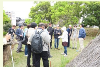
福岡市視覚障害者福祉協会の見学

4月28日には、福岡市視覚障害者福祉協会のみなさんと板付遺跡（博多区板付3）の見学会を行いました。板付遺