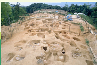
発掘当時の金隈遺跡

この50年間で発掘した場所は2,500か所を超え、今も市内のどこかで発掘が行われています。刊行した発掘調査報告書は約1,400集となります。これらの蓄積が博物館の展示や歴史講座、市史編さん事業に活かされています。これからも地域の歴史・文化の継承のため、より一層の調査の充実と公開・活用に努めてまいります。