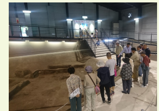
野方遺跡での展示解説（5/11）