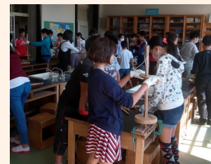
火起こし体験の様子

出前授業では各校区の遺跡から出土した土器などを持参し、直接手にとって触れることで歴史を身近に感じてもらいます。その後は「火起こし」「銅鏡作り」といった古代の生活体験をします。作業中はみんな真剣そのもの。煙がでたり火がついたりした時は歓声があがります。