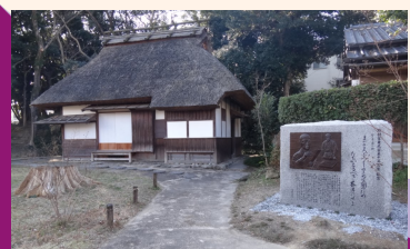
復元された草庵と望東尼150年忌記念碑

山荘と管理棟(展示室)の見学時間は、9時～17時まで。年中無休で、園内はいつでも見学可能。