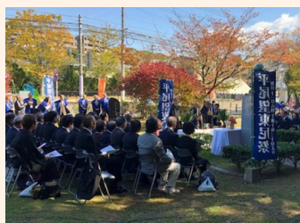
今年11月の望東尼祭の様子

今年は、明治維新150年。幕末の動乱期、国のために身も心も尽くした望東尼に、ここ平尾山荘で思いを巡らせてみませんか。