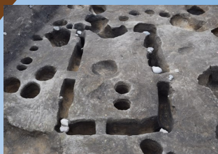
蔵と思われる建物跡

はごぎくう 宮崎宮近くで、平安～鎌倉時代（約 800～1000年前）の蔵の跡や数多くの井 戸などを発掘しました。遺跡からは、多量の中 国製の陶磁器や青銅製の小さな仏像、銅銭 約100枚などが出土しました。当時の人々の信 仰や、盛んな貿易活動がうかがえます。