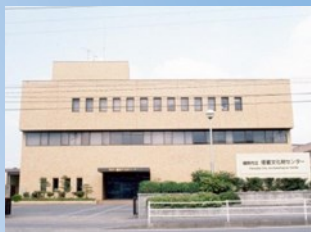
埋蔵文化財センター外観

福岡市内の発掘調査で出土した遺物や記録類を保管・活用するため、昭和57(1982)年に開館しました。 博多区井相田の板付中学校の隣にあります。