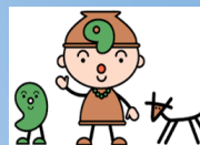
たまちゃん コウコ しかさん

今年度の考古学講座のテーマは「絵画と造形」。年8回の講座で、旧石器時代から近世まで、さまざまな物に描かれた絵や土偶・埴輪・人形などといった造形物を取り上げます。研究の第一線で活躍する講師が、福岡市の発掘調査の成果をふまえながら解説します。