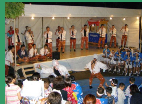
大人も子どもと一緒に楽しむ行事です