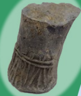
今回発見した 硯の脚部