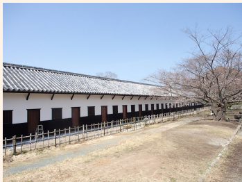
よみがえった多間櫓

歴史の風でたびたびお伝えしてきた福岡城南丸多間櫓の保存修理工事が、ついに今年の3月で終了しました。工事は、昨年度は隅櫓を、今年度は平櫓の工事を実施しました。地震の影響や経年変化で生じていた壁の亀裂や漆喰のはがれの修復、傷んだ木材や割れた瓦の交換を行い、漆喰塗りの白と下見板張りの黒のコントラストも美しい姿によみがえりました。