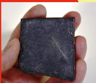
比恵遺跡群で出土した硯