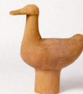
水鳥をかたどった埴輪

埋蔵文化財センターでは、毎年、テーマを決めて月に1度計8回程度の考古学講座を開催しています。今年度のテーマは「動物」です。犬や猫、ニワトリや馬、さらには妖怪まで、各月いろいろな動物たちがみなさんをお待ちしています。