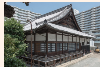
松源寺本堂正側面（南側から）

松源寺本堂は、正面5間、側面11間、大母屋造本瓦葺の建物で、細部は明治時代の特色がよく表れた彫刻等で飾られています。明治6年に竹槍一揆で焼失した後、藩主家菩提寺が困窮したのと対照的に、檀家の奔走により崇福寺仏殿を譲り受け、明治12年に再建されたといわれています。松源寺は、南西を流れる石堂川と南東を走る唐津街道・金出街道（篠栗街道）の交差点に位置しており、ランドマークとしても重要な景観をなしています。これらの点が評価され、平成30年3月に本市の21件目の登録有形文化財（建造物）となりました。