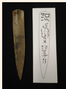
月替わり特別展示 (12月)