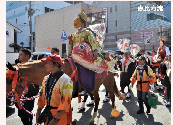
松囃子は福神・恵比寿・大黒の三福神と稚児舞からなる

5月の博多どんたく港まつりの中で行われますが、本来、小正月(旧正月15日)の行事でした。江戸時代に貝原益軒によって書かれた『筑前国続風土記』には「博多にて正月十五日に松囃子といふ事を取行ふ。」とあります。博多松囃子は、その後様々な行事に取り込まれる中で日程が変化していき、現在の日程で行われるようになったのは昭和24年(1949)からです。