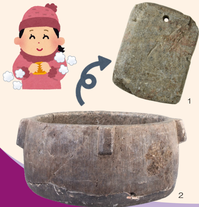
1.温石 博多遺跡群第22次調査（重要文化財） 2.滑石製石鍋 博多遺跡群第80次調査（重要文化財）

温石の材料となる滑石は、当時煮炊きに使われていた滑石製石鍋（写真2）を再利用したようです。エコですね。