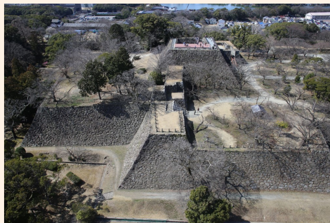
木々の葉が落ちて姿を現した、本丸・天守台の石垣

風も冷たく、つつい外に出るのが少なくなりがちな季節ですが、福岡城の「石垣」をじっくり見るには、木の葉が落ち、草も枯れるこの冬の季節が最適です。夏の間、木々の緑に隠されていた石垣が遠くからでもよく見え、高さ10mを超える本丸の石垣の迫力や、二の丸北側の石垣の複雑な形は、この時期が最も映えて見えます。