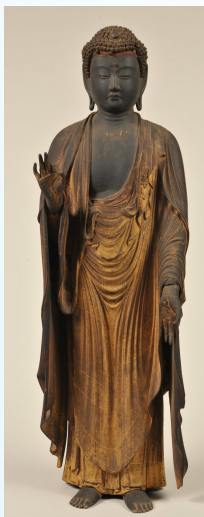
【木造阿弥陀如来立像】

さて、どうして、この仏像の制作年 や作者が明らかになったのでしょうか？ 実は、像の底部から銘文がみつかっ たからです。銘文は朱漆で「仁治三 年九月十五日 法橋快成 しゅうるし 」と記さ れていました。