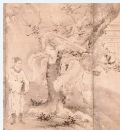
【東坡風水洞図】※一部拡大

「東坡風水洞図」は、中国の詩人蘇軾（東坡、画面右）が、友人の李節推（画面中央）に会いにゆく場面を表しています。この図にも梅が登場し（画面左）、馬が木を揺らして散った花びらが水面に浮かぶ様子を描いています。