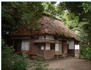
【市指定史跡・平尾山荘】（中央区平尾）

市指定文化財には、平尾山荘や黒田家墓所（史跡）、福岡城跡の名島門（建造物）、市登録文化財には旧福岡市動物園正門（建造物）などがあり、市内各地で見学することができます。