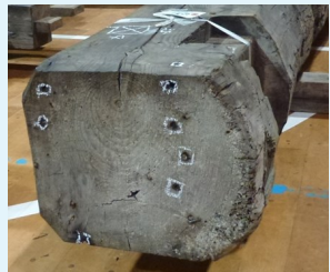
四角い印は江戸時代の角釘の痕跡