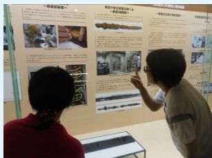
第1展示室リニューアル