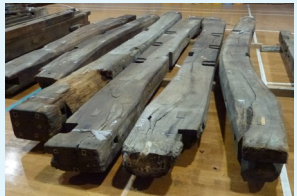
解体された潮見櫓の部材

今後、復元整備の進捗 しんちよく 状況を報告していきますので、ぜひご期待ください。