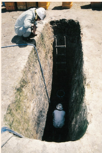
トイレの発掘風景

形は長方形のもの（右の写真）と正方形のものがあります。長方形のトイレは、なんと長さが3～4m、幅が1m、深さは4m以上！硬い岩盤を掘り抜き、砂の層まで深く掘ることで、底に水分がたまらないようにしたのででしょうか。