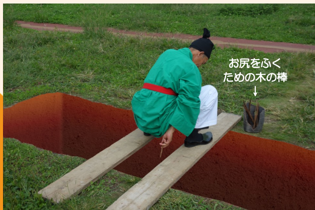
使用再現図（鴻臚館トイレ遺構にて）※穴は画像加工

では、こんなに大きくて深～いトイレ、どうやって使っていたの？下の写真のように穴に板を渡し、またがって使っていたようです。落ちたら大変ですね・・・