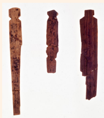
トイレから出土した木簡

お尻を木のへらで拭う時代もあったのです。トイレットペーパーのある時代に生まれてよかった!?