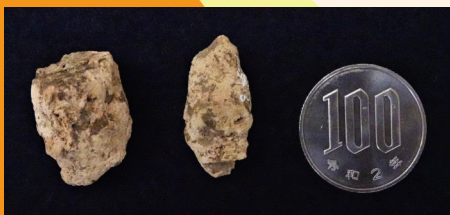
板付遺跡で出土した糞石