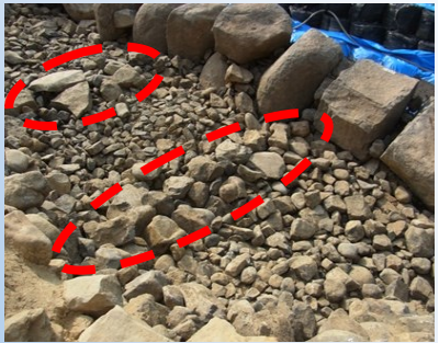
石垣内部の拡大写真

かみのほしごもん 上之橋御門石垣の解体調査で発見された石垣内部の「石列」です。石垣の表面の巨大な石の背後には「 うらごめいし 裏込石」と呼ばれる直径10～20cm前後の石が詰められています。裏込石は主に雨水を排水する働きがあり、これまでは無造作に詰められたと考えられていました。