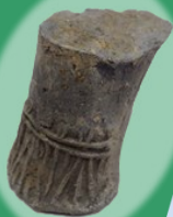
今回発見した 硯の脚部