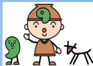
たまちゃん コウコ しかさん

今年度の考古学講座のテーマは「絵画と造形」。年8回の講座で、旧石器時代から近世まで、さまざまな物に描かれた絵や土偶・埴輪・人形などといった造形物を取り上げます。研究の第一線で活躍する講師が、福岡市の発掘調査の成果をふまえながら解説します。