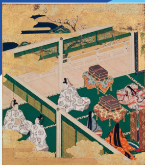
重要文化財 源氏物語絵巻紙帖「絵合」 京都国立博物館蔵

2017年、鴻臚館跡は、中山平次郎博士による発見から100年、旧平和台野球場での発掘調査の開始から30年を迎えます。これを記念し、「よみがえれ！鴻臚