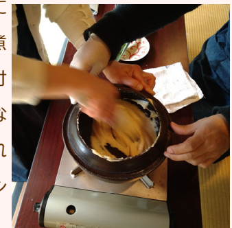
牛乳を混ぜながら煮詰めます

作り方は簡単。牛乳を鍋に入れて加熱し、固まるまで煮詰めるだけです。ただし焦げ付きやすいので常にヘラで混ぜながら長時間鍋の前にいなければなりません。現代ではテフロン加工の鍋もあるので当時に比べると楽なはずですが、意外に大変な作業です。完成した蘇は少し甘く そぼく 素朴な味がします。色々な食材を混ぜたり、トッピングして楽しむこともできます。皆さんもお家時間に「蘇」を作って、古代を感じてみませんか。