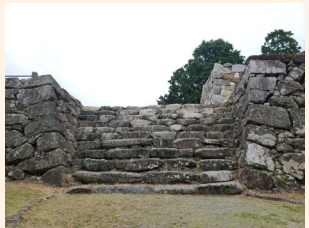
作戦終了後の小中守台の様子

7月17日(土)、総勢30名の令和の御掃除之者の皆さんと一緒に、石垣を傷付けないよう鎌やハサミを使用して丁寧