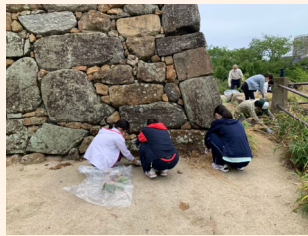
御掃除之者 いざ出陣！