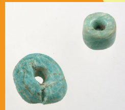
アマゾナイト製の玉類

当センターでは今年度、このように考古学と自然科学が融合し、新たな見地を生み出す「第二の発掘」をテーマに、企画展示と講座を開催しています。ご来館の前には、事前に埋蔵文化財センターホームページをご確認ください。