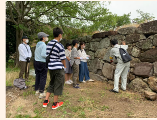
石垣の解説もあるよ！

広大な敷地を誇る福岡城跡の夏は、石垣に生い茂る「雑草」との戦いです。今夏の戦いに向け、「福岡城御掃除之者大作戦」と題して、SNSで清掃ボランティアを募集しました。「御掃除之者」とは、かつて福岡城に存在し、城の清掃を主な任務とした役職のことです。