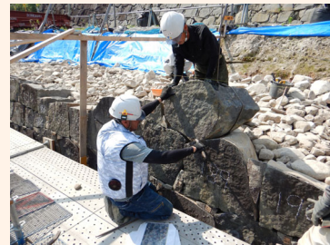
石垣の積みなおし作業

私は、石垣の復旧作業に携わっています。熊本城の石垣には、上部が急勾配となる「武者返し」が多くみられます。福岡城と比較しながら見学するのも楽しいですよ！