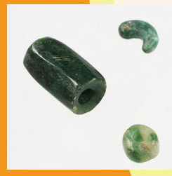
クロム白雲母の玉類

縄文時代から古墳時代にかけては北陸地方で産出される緑色の硬玉(ヒスイ)が特に好まれ、福岡でも出土しています。緑色の玉の石材は、これまで北陸産のヒスイと考えられる傾向にありましたが、成分を分析する調査の結果、一見ただけではヒスイと見分けがつかない「クロム白雲母」や「アマゾナイト」という石が多く用いられていることがわかってきました。特に前者の石材は九州を産地とする可能性もあり、当時の流通や交易などの研究にも期待が寄せられます。