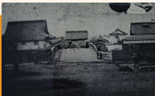
「石堂口門と石堂橋」(明治初年頃)

葉が黄金色になる晩秋が楽しみですね。お近くにお越しの際は、江戸時代の景観も想像しながら、眺めてみてください！