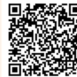
「福岡市の文化財」 Instagramはこちら

これから定期的に、「福岡城御掃除之者大作戦」を開催する予定です。大切な福岡市の宝「福岡城跡」を守る活動です。関心のある方は「福岡市の文化財」SNSをご確認いただき、是非ご参加ください！