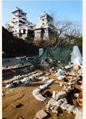
平櫓台の発掘調査 (奥は天守閣)

福岡市は、平成28年熊本地震で被災した特別史跡熊本城跡の復旧事業に文化財を専門とする職員を派遣しています。