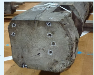
四角い印は江戸時代の角釘の痕跡