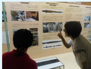
第1展示室リニューアル