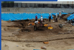
掘り下げている黒い部分が古墳周溝とみられる。