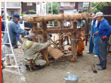
山笠土台の組み立てのようす

東区唐原に伝わる山笠行事です。毎年7月13日の前の日曜日に、集落の氏神である須賀神社(祇園宮)の祭礼として行われている行事です。山作りや山担ぎなど、山笠に関わる行事すべてを、地元の人々が担っています。北部九州には、博多祇園山笠の影響を受けている祭礼が点在していますが、唐原の祇園山笠行事はその一典型といえます。