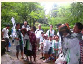
飯盛の夏越しの獅子回し

市内には、獅子が集落の家々を訪問し、無病息災や五穀豊穡を祈願する「門祓いの獅子」に類する行事が約30か所で行われています。そのうち、今回は西・早良区の13件を市の文化財に登録しました。行事の多くは7月に神社の夏越しの祓の祭りにあわせて行われ、地域の青年や子どもたちが参加します。近世から近代にかけて地域に定着し、継承されてきた民俗行事として重要です。