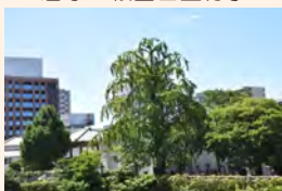
一行寺のシダレイチョウ