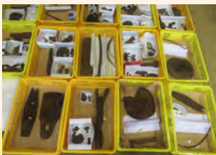
保存処理が完了した木製品