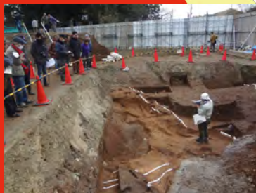
現地説明会のようす