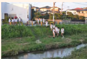
野芥櫛田神社の獅子舞