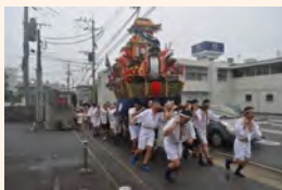
唐原の祇園山笠行事