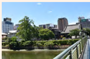
一行寺とシダレイチョウ

福岡市博多区中呉服町に所在する浄土宗一行寺に植えられているイチヨウの木です。真っ直ぐ伸びた幹から四方に枝が垂れ下がり、端正な樹形が特徴です。一行寺は石堂川のほとり、唐津街道沿