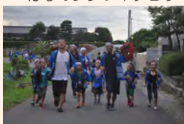
東入部熊本の獅子まわし