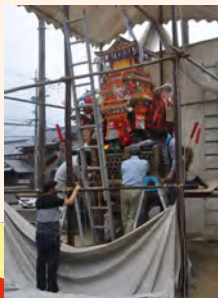
人形の飾りつけのようす