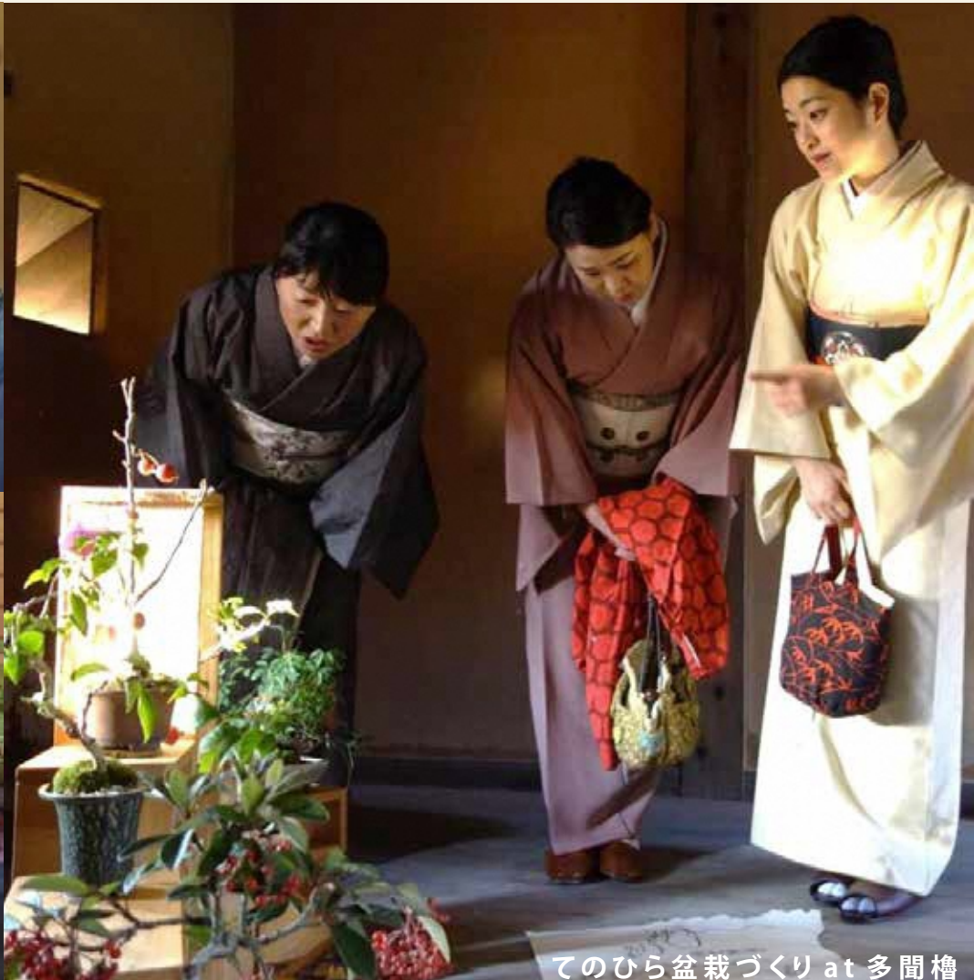
てのひら盆栽づくり at 多聞櫓