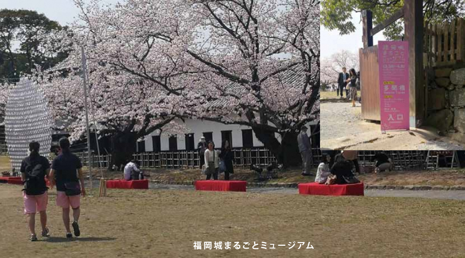
福岡城まるとミュージアム

伝統的な和物から最先端な展示まで可能な懐の深い内部空間— —南丸広場と一体的に活用することで非日常的なイベント演出も可能