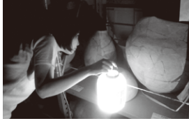
収蔵庫暗闇ツアーイメージ