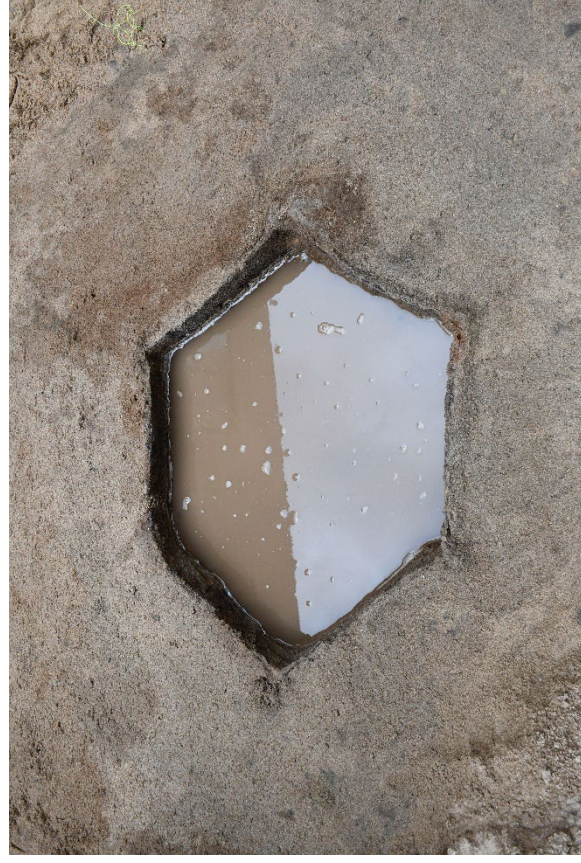
博多遺跡群 274 次調査 中世の井戸