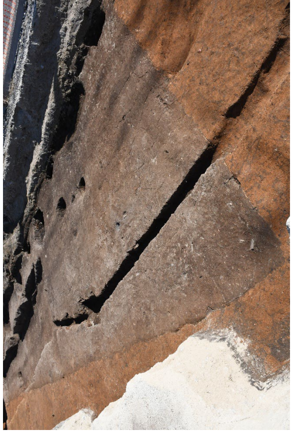
比恵遺跡群 163 次調査 弥生時代から古墳時代の方形環溝