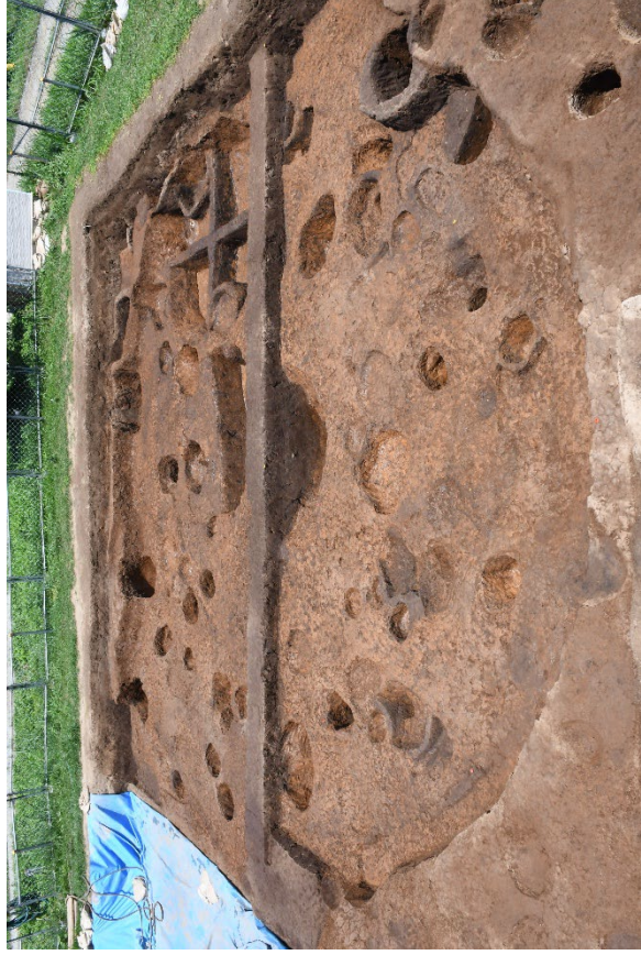
那珂遺跡群 203 次調査 弥生時代中期の円形竪穴建物