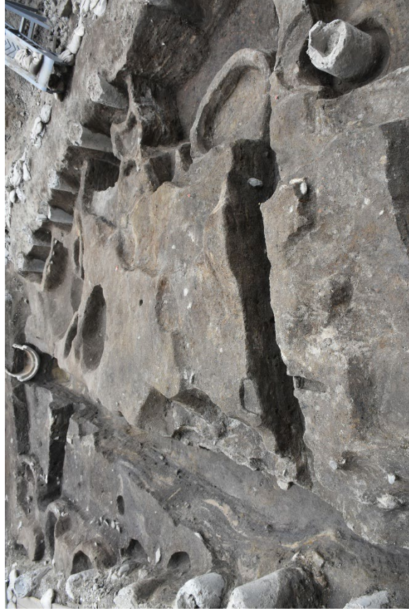
博多遺跡群 273 次調査 戦国時代の道路