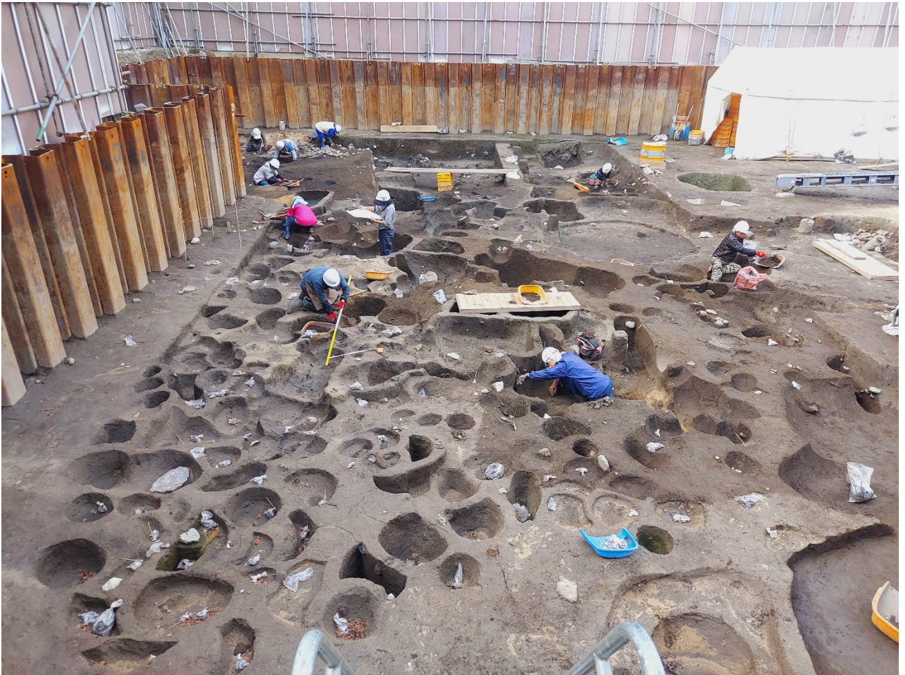
博多遺跡群第275次調査