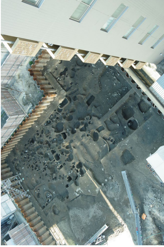
博多遺跡群 275 次調査 中世の都市遺跡