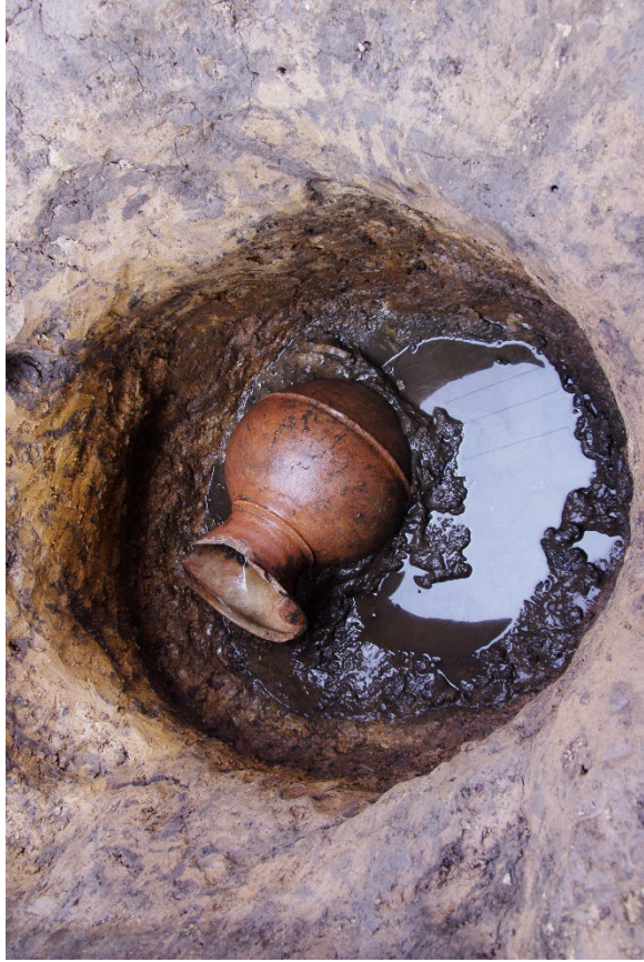
井尻 B 遺跡 62 次調査 弥生時代後期の井戸