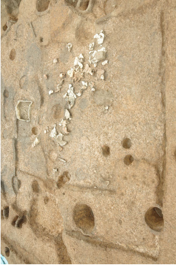
那珂遺跡群 201 次調査 弥生時代後期の方形竪穴建物