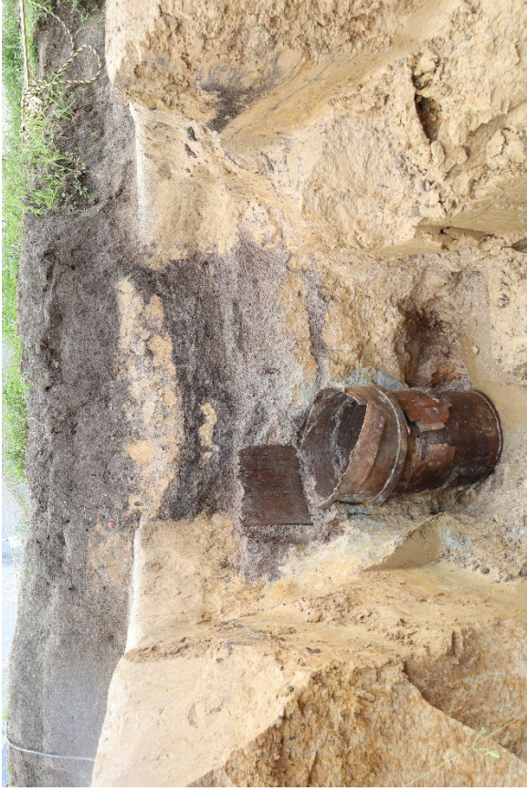
井相田 A 遺跡 5 次調査 鎌倉時代の井戸