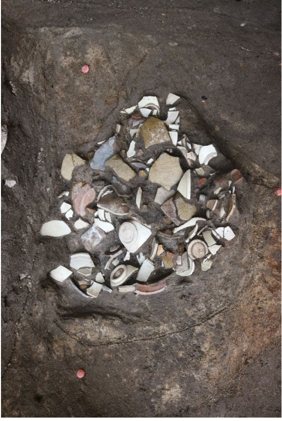
博多遺跡群 265 次調査 平安時代後半の廃棄土坑