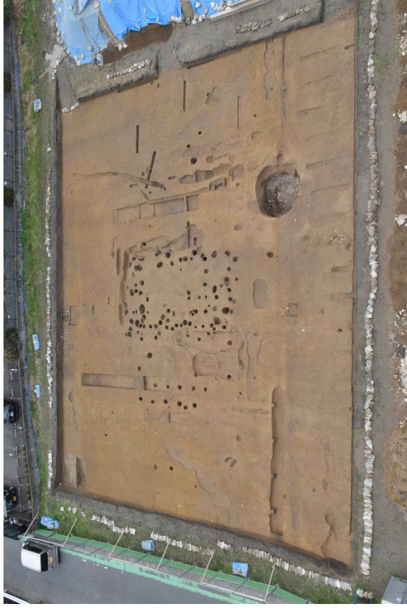
田村遺跡 31 次調査 中世の集落