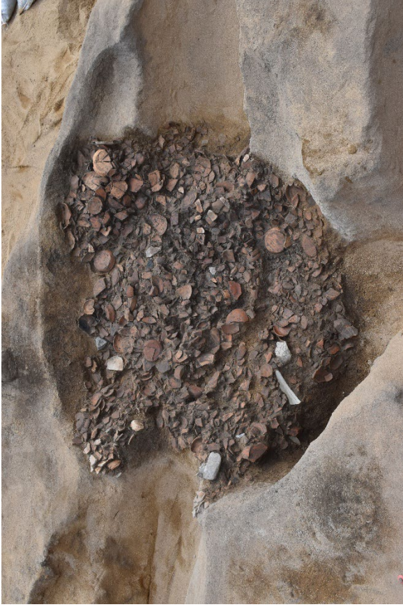
箱崎遺跡 133 次調査 鎌倉時代の土師器廃棄