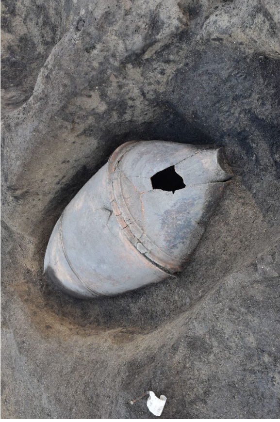
井相田 A 遺跡 6 次 弥生時代中期の甕棺墓