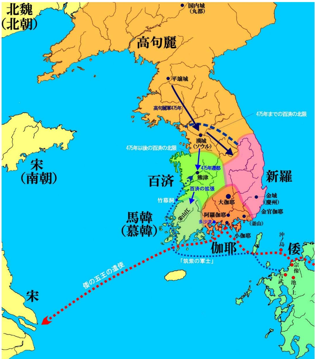
補足地図3（福岡市埋蔵文化財センター作成）