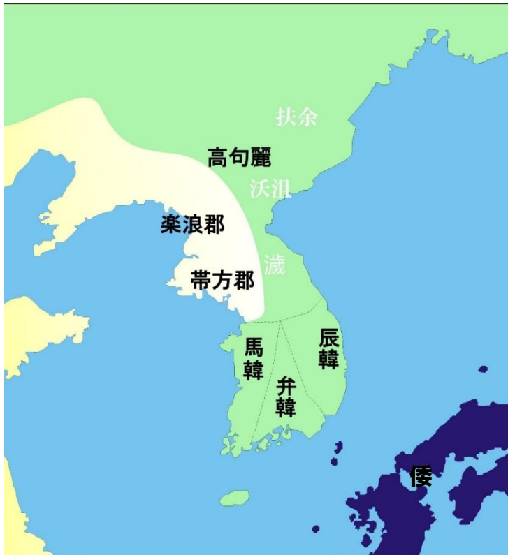
補足地図 1（福岡市埋蔵文化財センター作成）