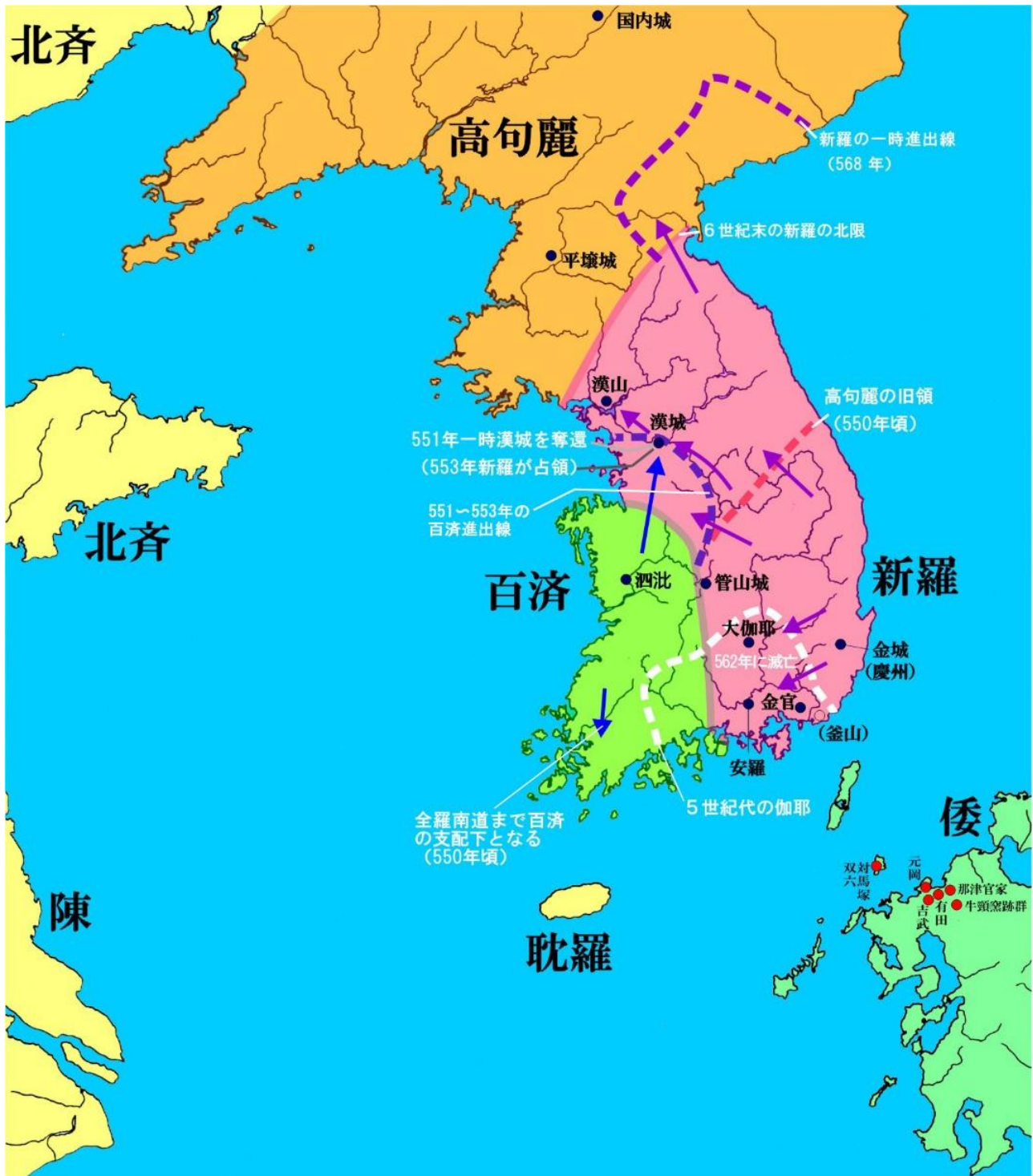
補足地図5（福岡市埋蔵文化財センター作成）