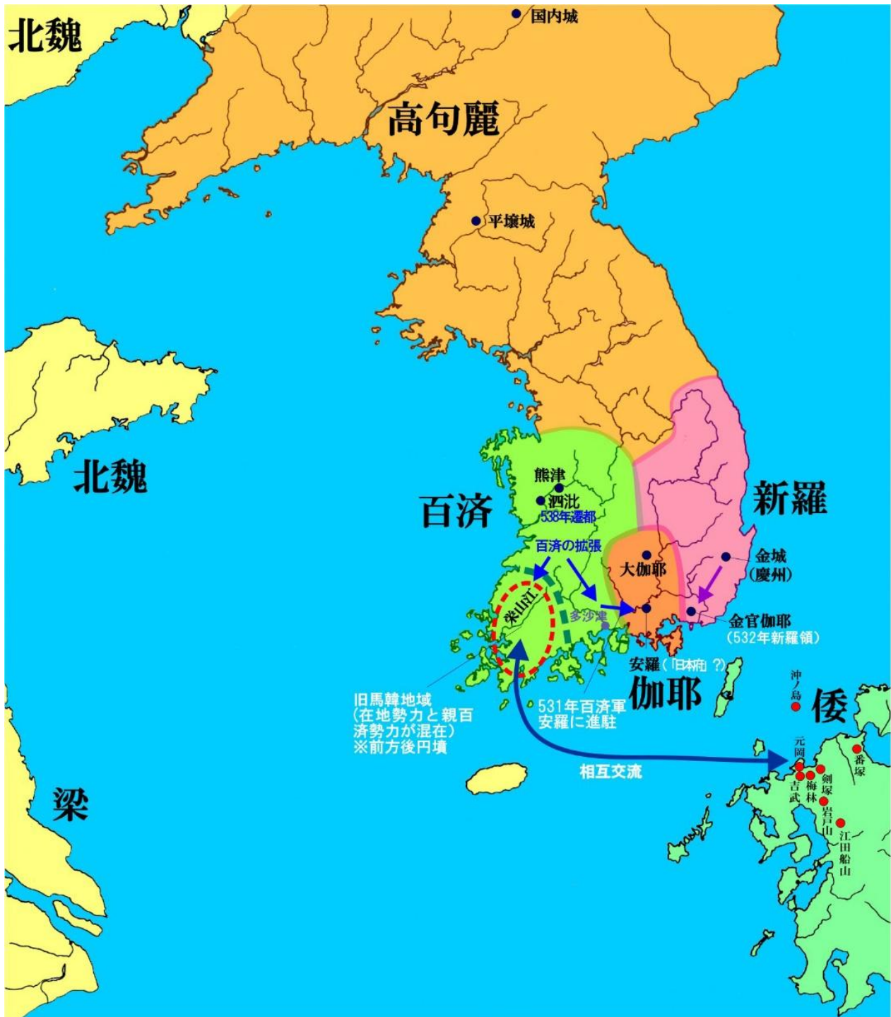
補足地図4（福岡市埋蔵文化財センター作成）