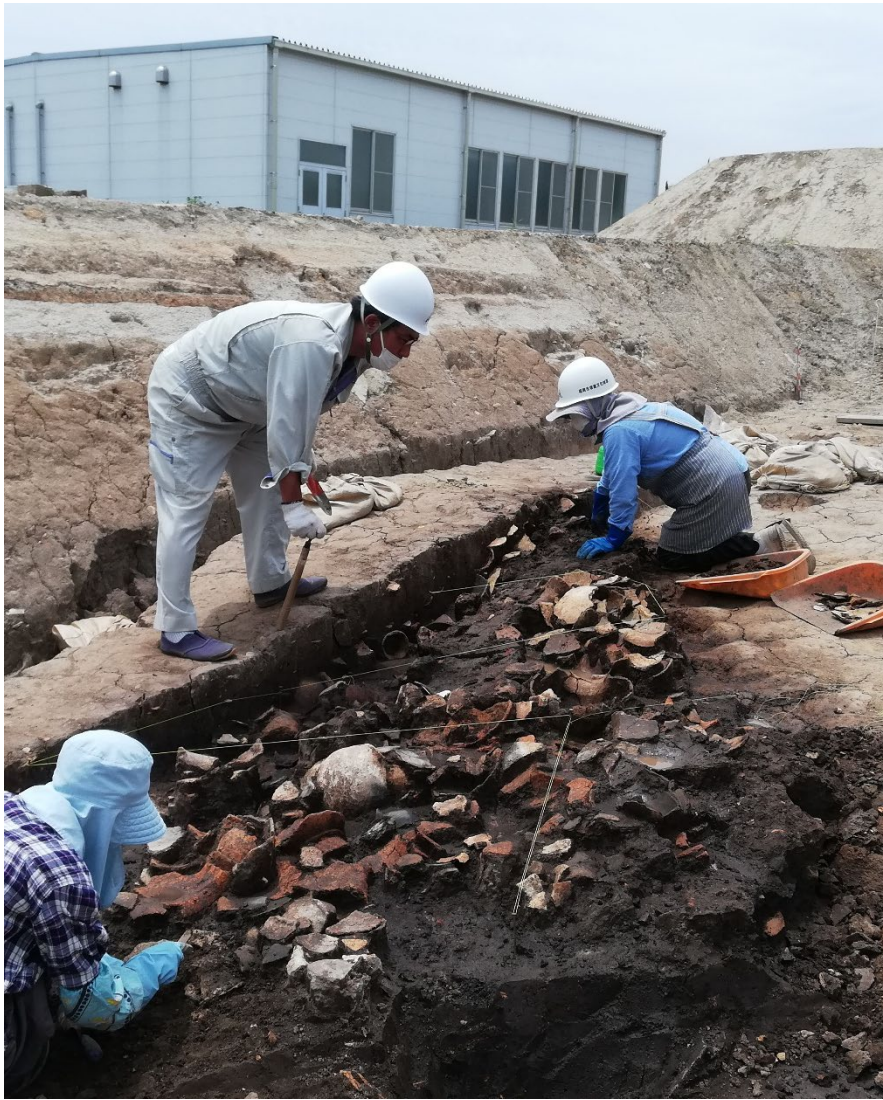
高畑遺跡第23次調査