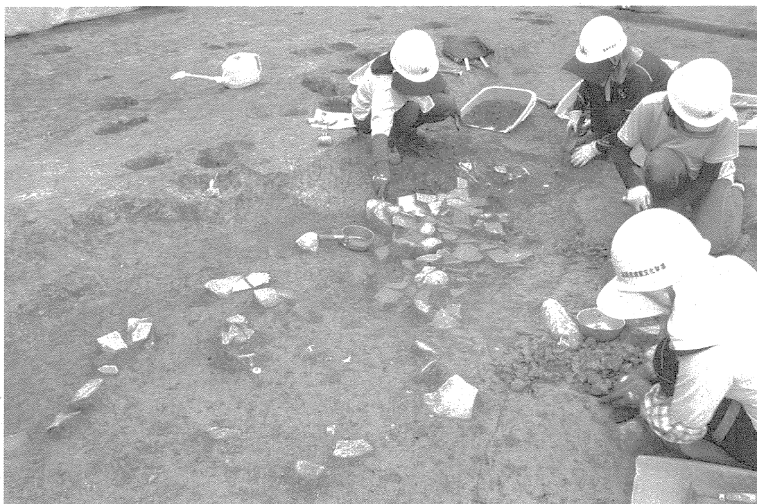
那珂遺跡群 185 次調査