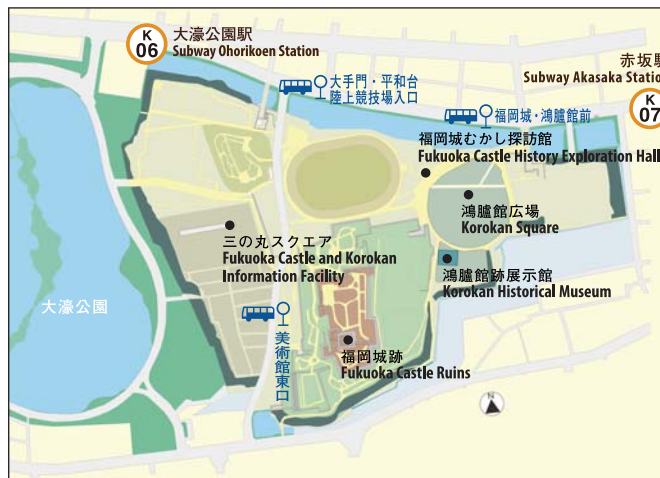
史跡鴻臚館跡 周辺案内図 / Kourokan Guide Map

TEL 092-721-0282 URL http://bunkazai.city.fukuoka.lg.jp/