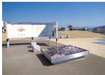
特定集団墓「最古の王墓」