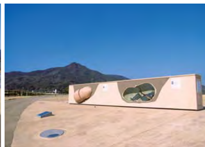
甕棺墓群「甕棺ロード」