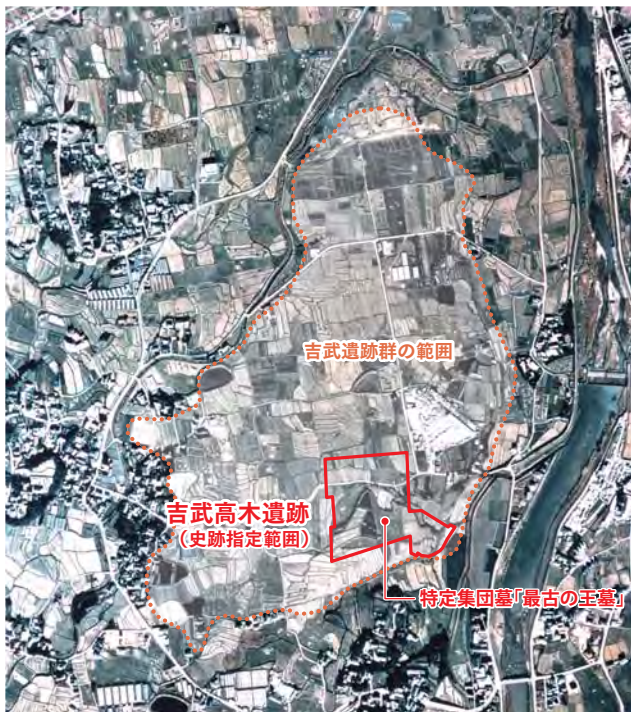
吉武高木遺跡と吉武遺跡群 (1970年代撮影航空写真)