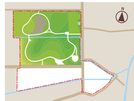
赤枠が史跡指定地。白色が今後の整備予定地。