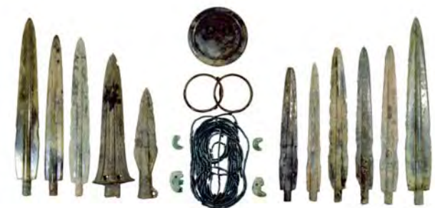
特定集団墓出土の青銅器とアクセサリー

弥生時代における国の始まりを知るうえで特に重要な遺跡として、平成5年に国の史跡に指定されました。