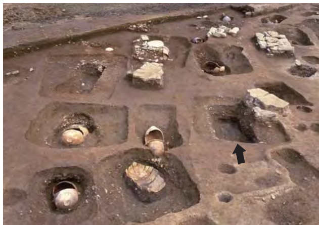
約2200年前の特定集団墓。矢印が「最古の王墓」。

公園に、「最古の王墓」「甕棺ロード」「大型建物」などの展示・解説コーナーのほか、イベントにも活用できる芝生広場・多目的広場があります。