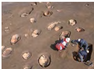
約200年にわたって作り続けられた「甕棺ロード」